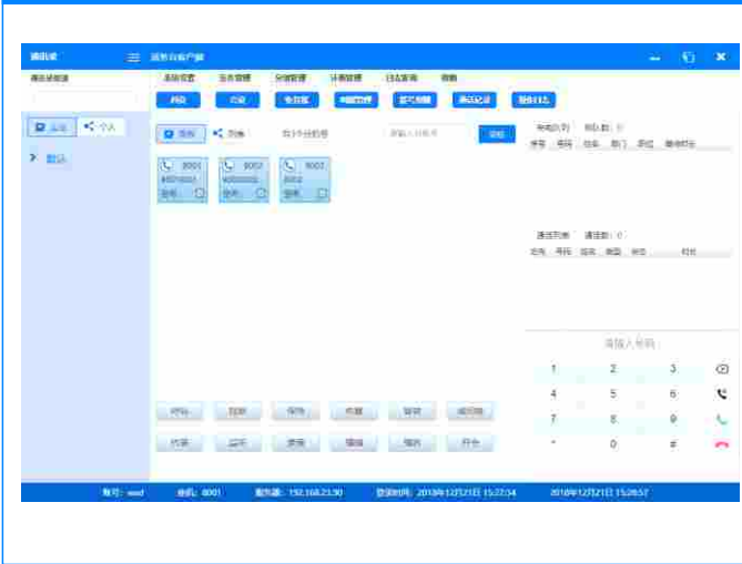
SKYNET话务台软件系统界面示意图